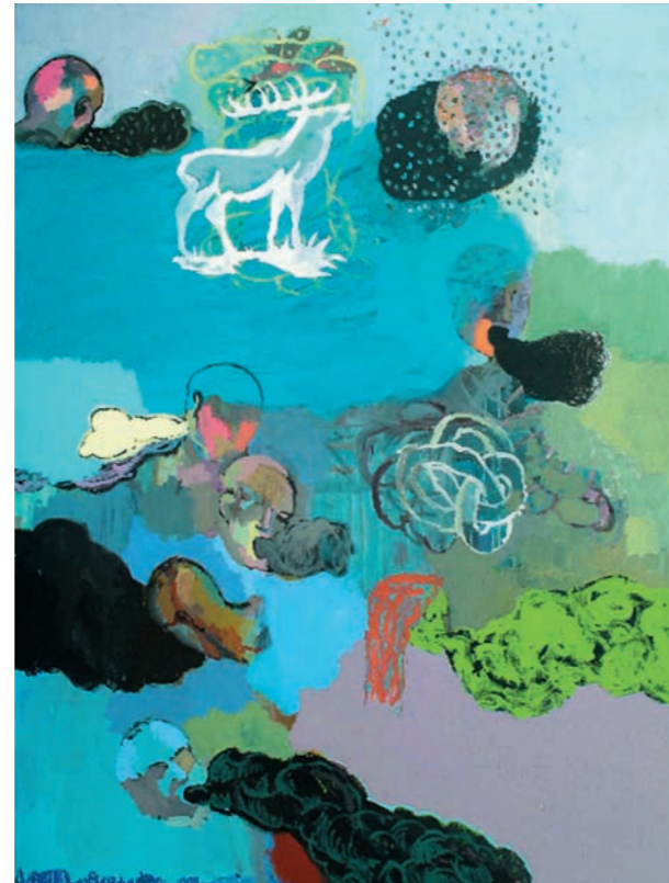
Armin Rohr, Ruf, 2005, Mischtechnik auf Leinwand, 200 x 150 cm

A6, Abfahrt St. Ingbert/Sulzbach, links Richtung Ensheim, nach ca. 200m links Richtung St. Ingbert Süd, im Kreisverkehr Richtung Stadtmitte. Nach ca. 1,8 km erreichen Sie die Galerie auf der linken Seite.