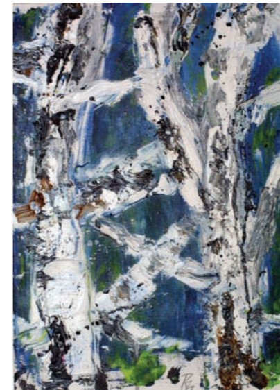
Reinhold Braun, Birken, Öl auf Leinwand, 25 x 35 cm