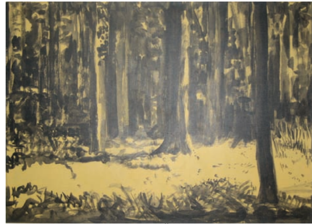
Achim Beier, Waldinneres, 2006, Öl auf Leinwand, 80 x 106 cm