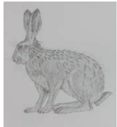
Natascha Pötz, Hase, 1999, Bleistift, 29 x 40 cm

Die Galerie ist am 13. Mai von 10 bis 18 Uhr geöffnet Ausstellungsdauer: 13. Mai bis 23. Juni 2007