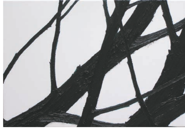
Helge Hommes, Ohne Titel, 2003, Öl auf Leinwand, 55 x 80 cm