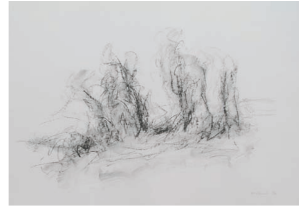
Ute Gortner, Ohne Titel, 1994, Kreide auf Karton, 64 x 93 cm