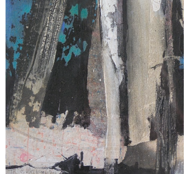
Thomas Kleemann, Stammbäume, 2006, Mischtechnik auf Leinwand, 20 x 20 cm