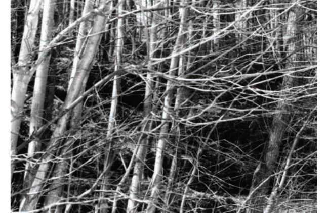
Swen Paustian, Ohne Titel, 2006, 70 x 90 cm, Tintendruck auf Alu-Dibond